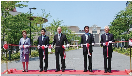
新キャンパス竣工 左から矢野会長・樋口明県議会議長 梶山千里学長・小川博知事・山中一男自治協議会会長

事務局 福岡女子大学内 TEL・FAX (092) 692-3194 HP - http://www.fwu.ac.jp/tukusimikai/ または「筑紫海会」で検索