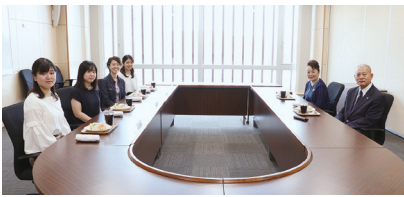
学生代表との御昼食会。学生たちに御自身の留学経験談も交えながら温かいお言葉をかけていただきました。