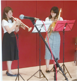
H30. 8. 2 納涼祭にてオーケストラ部員の演奏