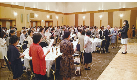
全員で女専と女子大の校歌斉唱

4 平成30年度事業計画案 薪能、筑紫海会賞贈呈、お茶の会、かすみ祭参加、ホームステイ実施、大学100周年記念事業への協力等を提案。 5 平成30年度予算案 昨年度の入会金の大幅減収150万円・会費減収34万円に伴い、予算を縮小。今年度は支部への補助金削減、事務費・会費等全体的に削減しての対応予定。来年度より最