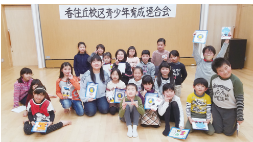
「香住っ子ひろば」の子どもたちと

私はこれまで、サークルやボランティア活動を通して学内外で様々な交流を行ってきました。それはひとえに、「卒業までに理想の