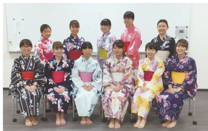
着付け教室の成果！浴衣美人勢揃い！

学生さん、着付けが終わったお互いの姿を見て、歓声が上がっていました。当日は、福岡市の最高気温が37度を超えた日でしたが、17時からの開会、司会者やスタッフの浴衣姿に涼風を感じた方も多かったと思います。納涼祭は、地域の方、留学生、学生の参加の下、宗像市からの出店あり、学生や地域の方の出し物ありで、あつという間の時間でした。その間、学生さんと地域の方の交流、香住丘高等学校の生徒さんの作品展の観学などにぎやかで、和やかな時間でした。地域の自治会の会長さん