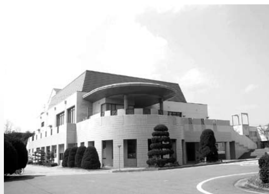
■交流会会場：大学会館