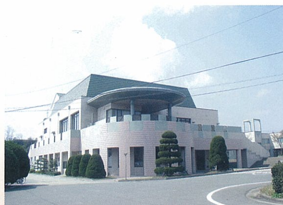
■シンポジウム会場：大会館