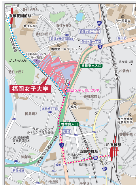
● 最寄駅からのアクセスマップ