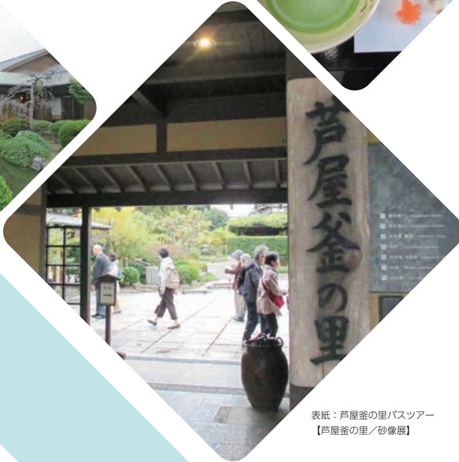
表紙：芦屋釜の里バスツアー 【芦屋釜の里／砂像展】