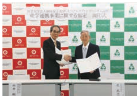
トータルケア・システム株式会社

本協定を通じて、それぞれの強みを生かした教育・研究の推進や、地域と連携した取り組みを一層充実させてまいります。