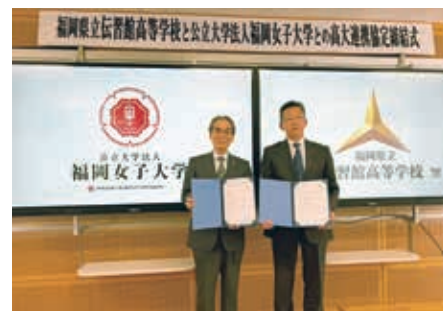
福岡県立伝習館高等学校