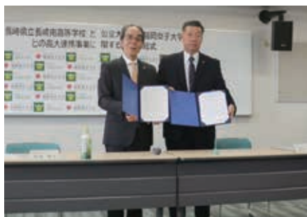
長崎県立長崎南高等学校